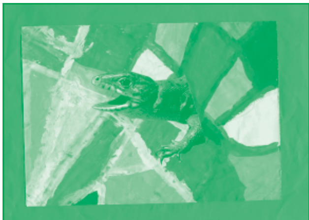
Ferencz Márk Petőfi Sándor Általános Iskola

De egyszer vásárra készültek. Az asszony ült a kanca lóra, az ember pedig a csődörre. Az asszony elmaradt egy kicsit. A csődör ekkor rányerített a kancára, hogy miért nem jön hamarább. Ez meg azt mondta: