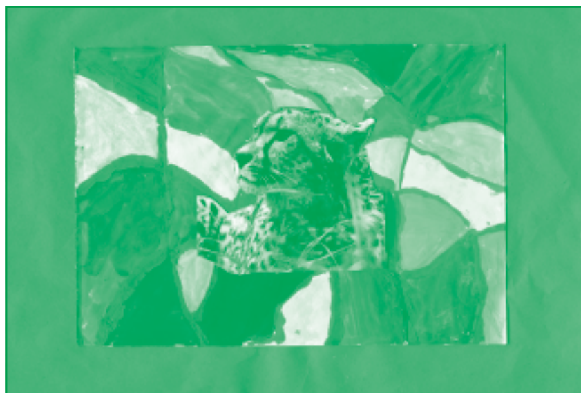
Epresi Regina 2/C Petőfi Sándor Általános Iskola

Kocsis Richard Dózsa György Általános Iskola