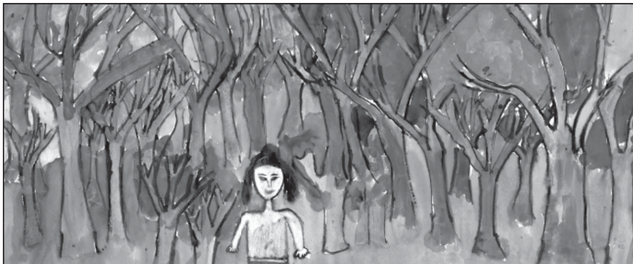
Kunos Kitti 4. oszt. (Feszty Á. ált. isk)