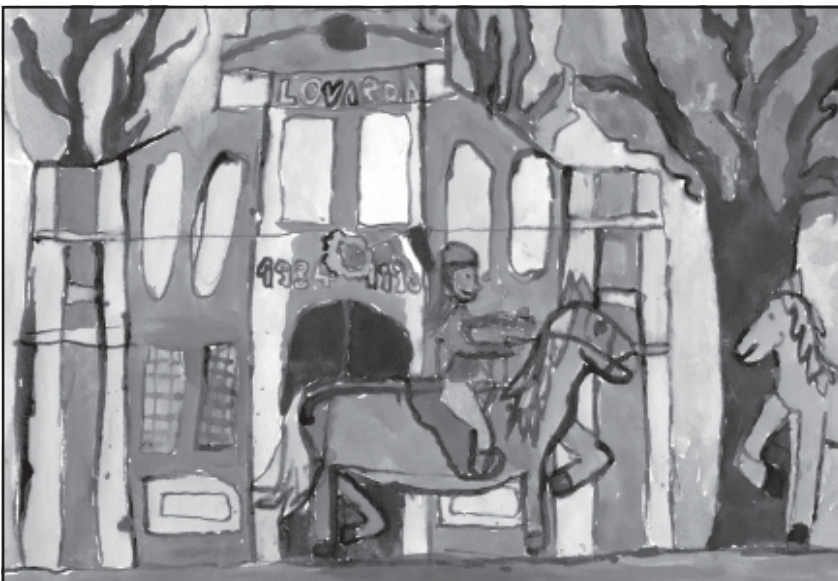
Horváth Csilla 4. oszt. (Feszty Á. ált. isk)