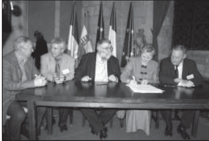
A nemzetközi kapcsolat hivatalos aláírásán

Az alakuláskor megfogalmazott célkitűzések ma is mérvadók. Ugyan a kezdeti lelkesedést egy stagnáló időszak követte, azonban az elmúlt évben bekövetkezett változás újra lendületet adott az országos tömörülésnek. Az NCA Demokrácia- és Partnerség-fejlesztési Kollégiuma támogatásának köszönhetően júniustól lehetőségünk nyílt az újrafogalmazásra. Így került előtérbe a területi képviselői rendszer újraszervezése, szakmaközi érdekképviseleti szervként új kapcsolatokat épít a kormányzati szervekkel, megyei és települési önkormányzatokkal, intézményekkel, gazdálkodó egységekkel, illetve mindezek érdekképviseleti szervezeteivel. A mecenatúrán túlmutatóan a kapcsolattartás és együttműködés új lehetőségeit keresi az üzleti-gazdasági szféra képviselőivel; a civil szféra új ajánlatait fogalmazza meg a gazdasági élet szereplői felé. Tevé-