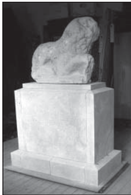
A másolat-készítés különböző fázisai