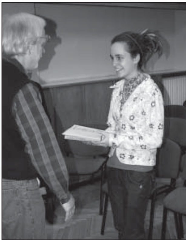
Az oklevél átvétele

Tanulmányainkból kiemeltünk egy témát, amit részletesen kielemeztünk, kidolgoztunk és egy konferenciát is tar-