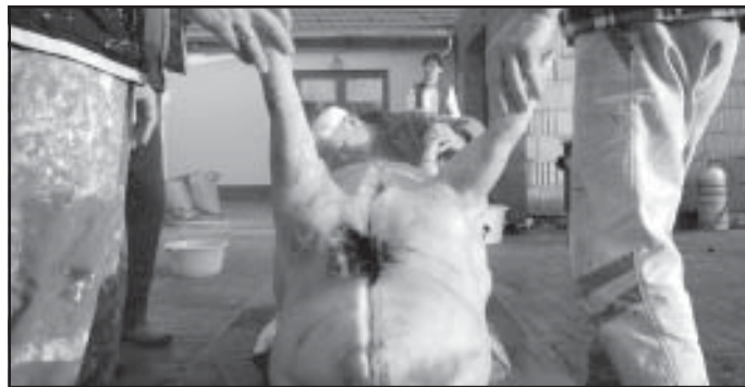
Megnézzük, mi van benne