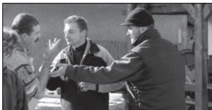
Talán még áldomást is iszunk rá