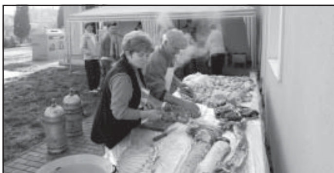
Mi tudunk mindent, meg is nyerjük a versenyt