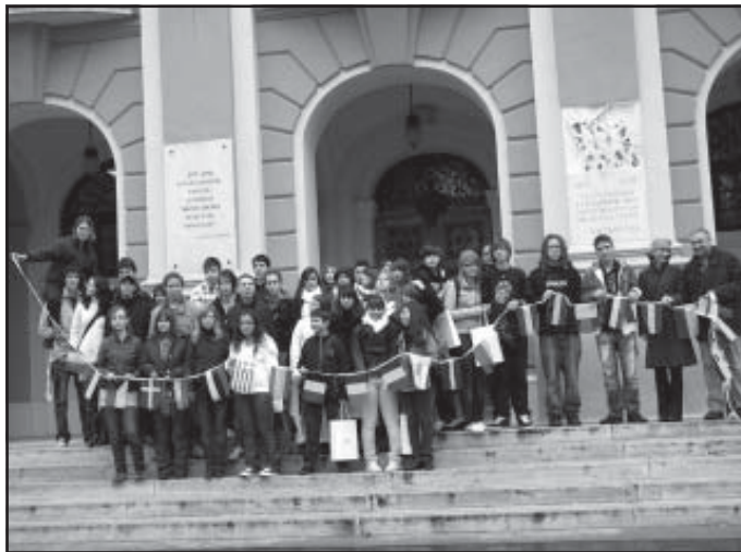
A közreműködő fiatalok

A közösség egy társadalmi csoport, amelyet az alkalmi vagy csupán korlátolt célokra alakult társulásokkal szemben, a közös érdekek alapján nagyfokú állandóság, az élet számos területére kiterjedő összetartozási tudat, és együttműködés, többnyire közös eszmék birtoka is jellemez.