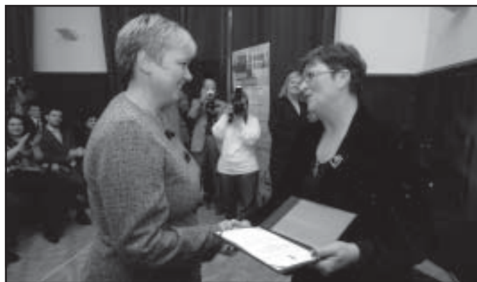
Minisztériumi oklevél átadó 2009-11-23

A képzési folyamatba én nem az osztályomon keresztül csöppentem bele, hanem az első Szót Kérünk! Ifjúsági Konferencián szembesültem a lehetőséggel. Akkor még nem is sejtettem, hogy mi is vár rám. Egy évvel ezelőtt a Fenyves tábortalálkozó alkalmával ismerkedtem meg az osztályokból összeállt csoporttal. A