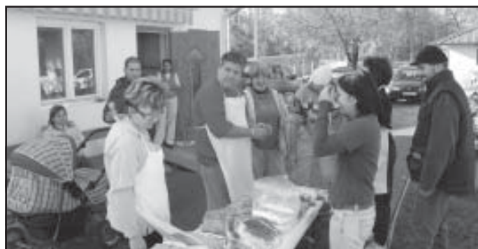
De, mit csináljunk belőle