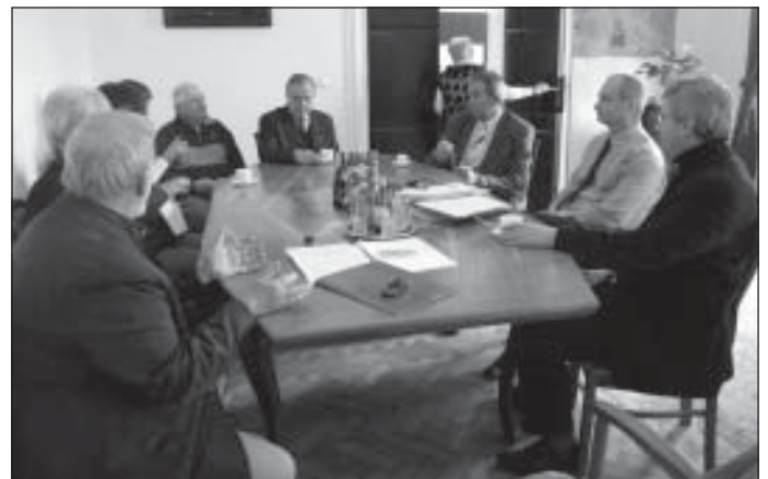
A polgármester úrnál