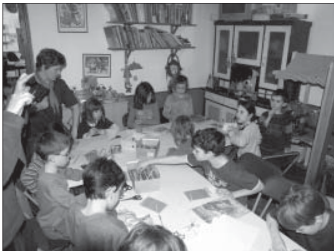
Munkában a kicsik

A cserkészlet egy olyan nagyszerű mozgalom, ahol minden olyan gyerek megtalálhatja a számítását, akiben van némi elszántság. Általános iskolás gyerekek, középiskolás fiatalok mozgalma ez, mégpedig a legrégebb és legnagyobb a világon. Benne