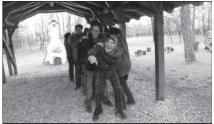
...és egy kis lazításban

A Komárom-Esztergom megyei ifjúsági közösségi munkások képzését a Szociális és Munkaügyi Minisztérium által támogatott Megyei Ifjúsági Módszertani Központ keretéből biztosítjuk.