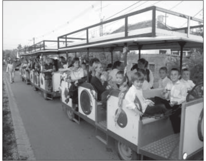
A kisvonat és utasai