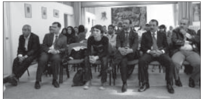
A bemutató előadáson